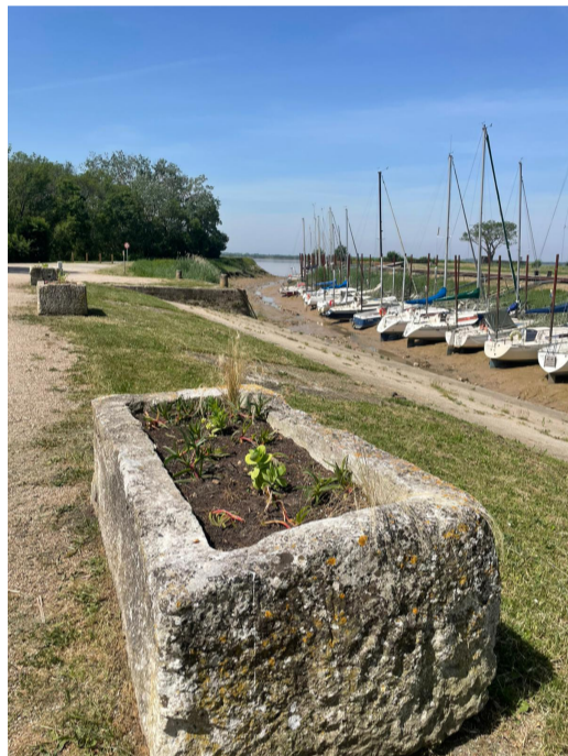
Petit rappel : les plantations font partie du bien commun et ne sont pas en libre service !