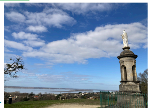
À la vierge