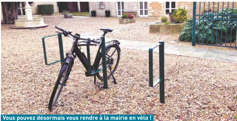
Vous pouvez désormais vous rendre à la mairie en vélo !